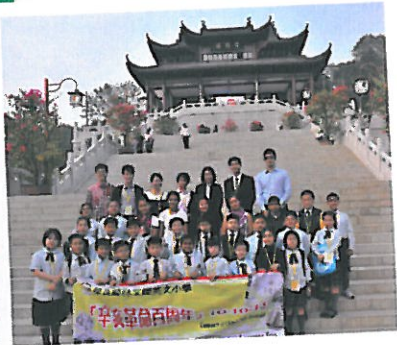
師生參觀武漢黃鶴樓。

10月10至12日，保良局林文燦英文小學舉辦了「辛亥百年國民教育學習活動」。四、五年級二十八名來自六個國家的中外籍學生在老師的帶領下，前往「辛亥革命首義之城」——武漢，開展了實地體驗活動。該活動得到「保良局教育事務部優質教育基金」的鼎力支持，以及得到湖北省教育廳、武漢市教育局，乃至東方神馬（武漢）實業有限公司的大力促成。