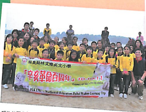
師生共同參加騎馬活動。

東方神馬（武漢）實業有限公司是由著名港商在當地投資興建的機構，該公司出於對香港教育事業的關心和支助，邀請我校師生到訪馬場，為我校的武漢之行作了詳盡的鋪排，並特備辛亥百年巨型畫布供我校師生合影留念，讓本次交流更具有紀念意義。隨後，馴馬師牽來馬匹，向所有師生手把手傳授騎馬的基本技能。活動中，學生克服恐懼，勇於嘗試，親身感受到騎馬的樂趣。引用當地官方的中肯評價：學生們樂於學習、敢於嘗試，這就是弘揚「辛亥革命首義精神」的最好表現。在10月10日這個極具歷史意義的日子裏，保良局林文燦英文小學能創造機會推行國民教育活動，把生於香港、長於香港的孩子們帶到曾在一百年前發起首義的城市，在體驗現在來之不易的幸福生活的同時，共同緬懷革命先烈的豐功偉績，引導學生體會「努力學習、珍惜生活」的重要性。這正是目前我們香港政府及教育界大力推行國民教育的真正意義所在。