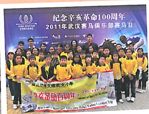
師生參觀東方神馬（武漢）實業有限公司。