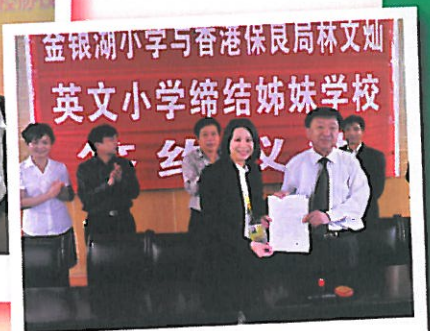
與武漢金銀湖小學簽約成為姊妹學校。